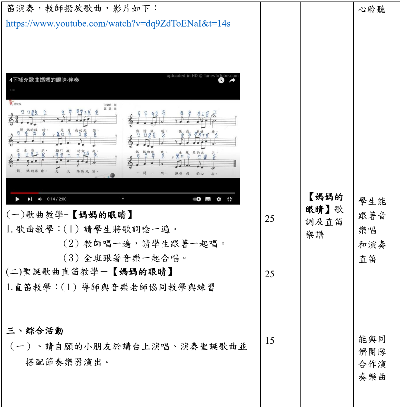
附錄(一)教學重點、學習紀錄與評量方式對照表